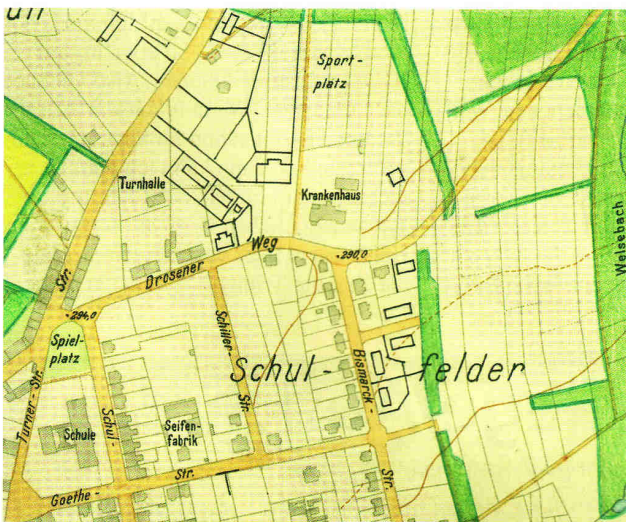
(Quelle: Grünflächenplan Ronneburg 1927, Ingenieurbüro Stiefelwagen, Gera)

Über die jetzige Bauphase der langen Straße der Opfer des Faschismus lassen wir unsere Stadtväter befinden und hoffen auf gutes Gelingen bei der Wiederanpflanzung der Straßenbäume. K. Jakob